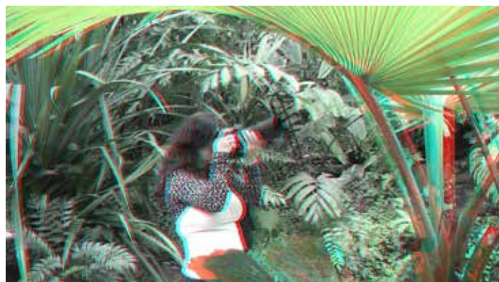
Anaglyf. Abyste viděli prostorový efekt, použijte brýle s azurovým a červeným filtrem.

k tomu, že musel jít ověšený jako vánoční stromek (brašna s kamerou, brašna s fotoaparátem, velký videostativ, brašna s počítačem), nemusela být jeho identifikace na monitorech složitá. Místo pachatele odvezli člena ochranky, protože byl celostátně hledaný. Tak Vám dochází, že nechat cokoli v kufru auta nebyl zrovna dobrý nápad, protože ty jejich kamery možná slouží k něčemu úplně jinému než k ochraně.