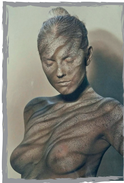
Autor - Jaromír Komenda