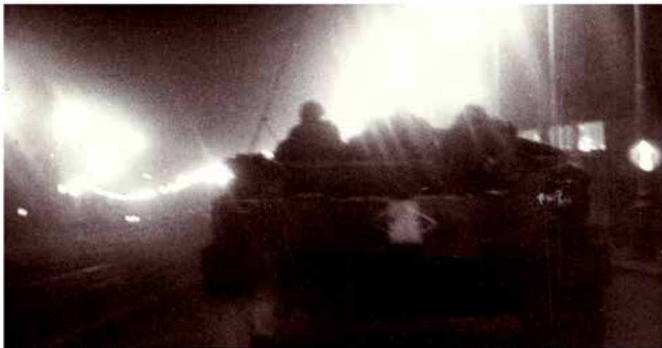
Fotografie z archivu na výstavě Nejdelší noc – 21. srpen 1968

nás nejvíce zaujaly fotografie, z nichž mnohé jsou vystaveny zcela poprvé. Muzeum Policie ČR v Praze 2, Ke Karlovu 453/1 má otevřeno od úterý do neděle od 10 do 17 hodin, pondělí je zavřeno. Vstupné: dospělí 30 Kč, děti, studenti, důchodci 10 Kč (odpoledne pro děti 5 Kč) a rodinné vstupné 50 Kč. Více na webu MuzeumPolicie.cz .